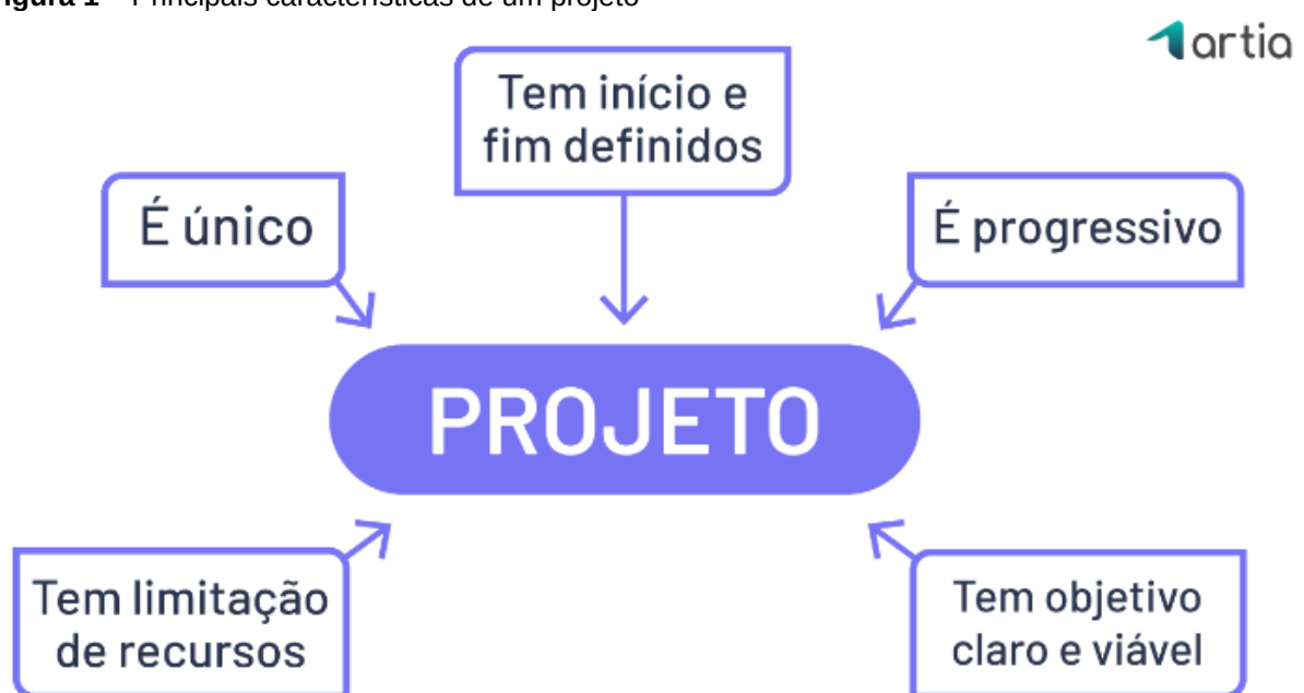
Figura 1 – Principais características de um projeto